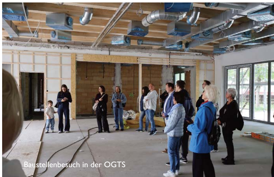
Baustellenbesuch in der OGTS

den Kindern ein Leseland, Ruhe- und Gestaltungsräume, ein Kinderrestaurant, Hausaufgabenbereiche sowie Musikräume zur Verfügung. Herzstück ist die große lichtdurchflutete Mensa sowie die eigens errichtete Zubereitungsküche. Insgesamt investiert die Gemeinde zehn Millionen Euro in die Ganzbetreuung der Kinder, eine gesetzliche Vorgabe des Bundes. Die Förderung beträgt rund 60 Prozent. Zum Abschluss des „StadtRundGangs“ erhielten die Teilnehmerinnen und Teilnehmer noch Informationen zur derzeit laufenden Baumaßnahme an der Halle West, die für rund eine Million Euro (80 Prozent Förderung) zu einem Jugendtreff umgebaut wird, sowie zur Festhalle. Dank des EUROPAN-Wettbewerbs gibt es eine gute Perspektive, das ortsbildprägende Gebäude zu erhalten. Entscheiden wird darüber der Gemeinderat in seiner Sitzung am 8. Juni, wie Porsch verdeutlichte.